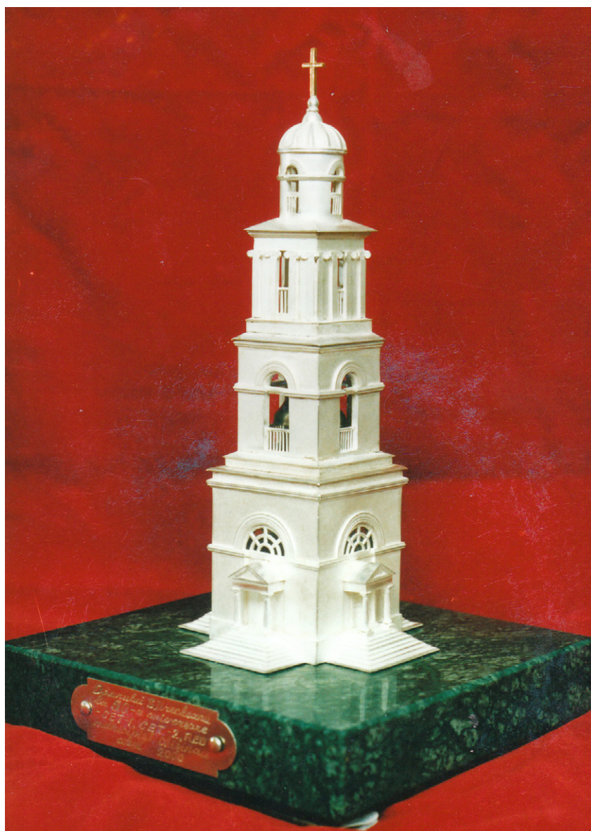
Gheorghe Cojusnean. Clopotnița Catedralei mitropolitane Nașterea Domnului din Chișinău.

mile reduse nicicum nu diminuează din măreția și splendoarea clopotniței, iar posibilitatea de a observa cel mai mic detaliu permite să descoperim valoarea istorică și artistică a acestui monument. Plasată pe un postament de malachit simbolizând puritatea și verdeața orașului Chișinău, clopotnița transpare ca o jucărie din poveste pe care o poți ține în mână și ore în șir să admiri fiecare element arhitectural realizat din marmoră. Poți urca imaginar până sus, să treci de la un nivel la altul, să te uiți prin fereastra miniaturală, ba chiar să încerci să auzi dangătul clopotului. Un veritabil simbol al capitalei, Clopotnița Catedralei mitropolitane Nașterea Domnului din