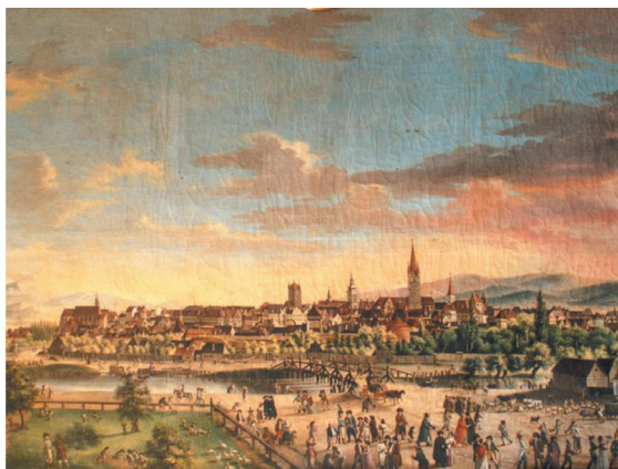
Sibiul în 1808. Pictura de Franz Neuhauser

malul râului Cibin. Aceștia erau iobagi la fermele sașilor (la fermele din Sibiu ale contelui Haller, documentele vorbesc de 25 iobagi în 1725) [5, p. 148], sau, în majoritatea cazurilor, erau oameni liberi care se angajau ca zilieri. Această suburbie se numea „Maieri”, iar în mod accidental era locuită chiar de câțiva unguri și țigani. Primul recensământ („conscriptie”) a măierilor s-a executat în 1711, cu scopul de a-i supune impozitelor. Cel din 1721 arată că măierimea era formată din 211 familii, impuse cu 1.180 florini [5, p. 152].