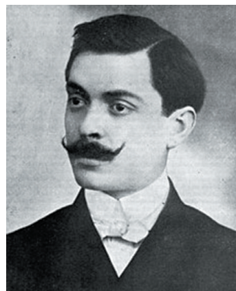
Șt. O. IOSIF

(ST. O. IOSIF, Poezii , București: Albatros, 1970, colecția Lyceum)