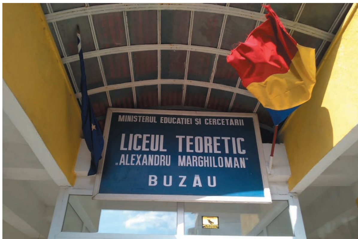
Liceul „Alexandru Marghiloman”

man” este un promotor al valorilor, prin rezultatele deosebite obținute de elevii săi la olimpiadele și concursurile locale, județene, naționale și internaționale, un model de organizator de activități și evenimente școlare, un exemplu de responsabilitate și siguranță. Atmosfera din „familia Marghiloman” se simte în cancelarie, în clase, pe holuri. Este o stare de bine la care am contribuit, zi de zi, cu toții.