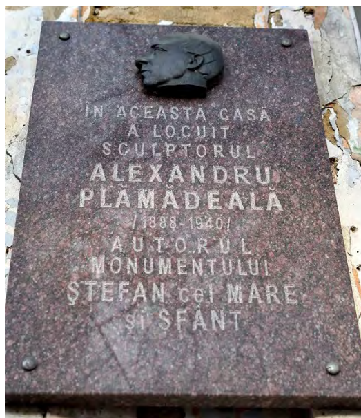
Placa comemorativă de pe casa familiei Plămădeală.

Keywords: Olga Plămădeală, Bucharest, architecture, Chișinău, Belle-Arte Society, chronicler.