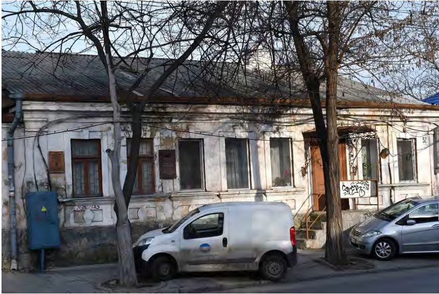
Casa familiei Plămădeală de pe strada București, 52. Imagine actuală.

3. Plămădeală, Olga. Cronica plastică . În: Viața Basarabiei , 1938, nr. 3, p. 75-76.