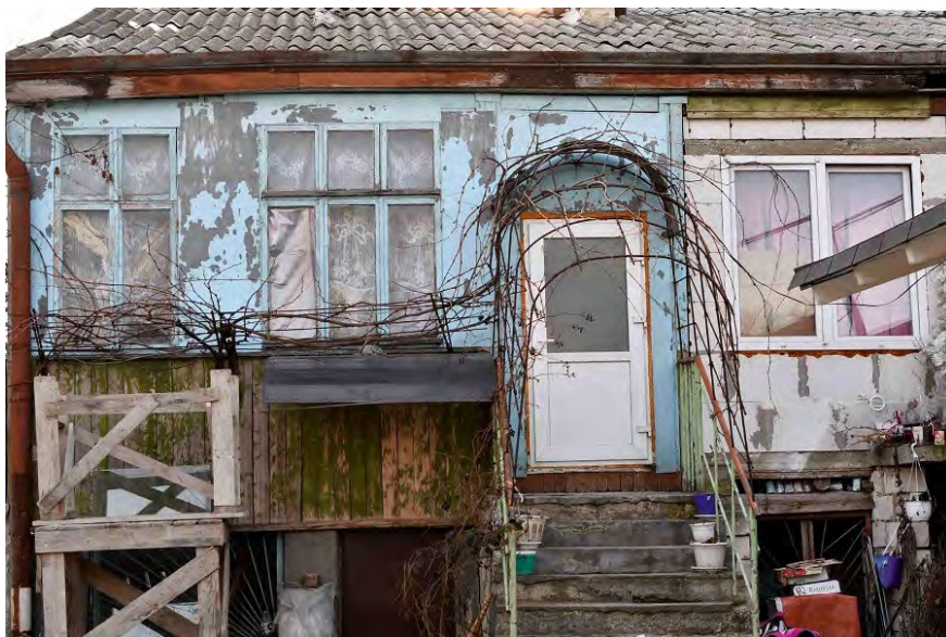
În curtea casei a familiei Plămădeală. Imagine actuală.