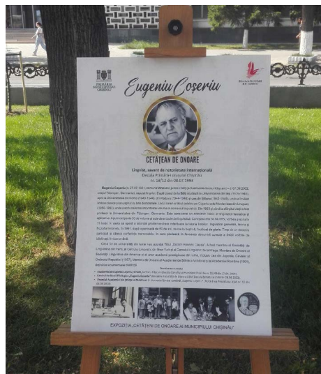
Expoziția „Cetățeni de onoare ai mun. Chișinău”, Aleea pietonală de pe bd. Grigore Vieru (18 iulie 2023). Poster dedicat lui Eugeniu Coșeriu, cetățean de onoare al municipiului Chișinău