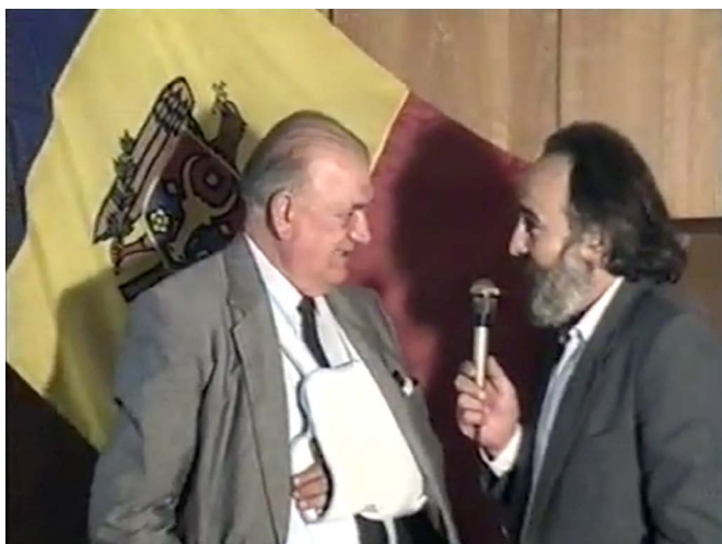
Eugeniu Coșeriu interviuat de regizorul Victor Bucătaru (8 iulie 1993)

Încă o mențiune despre acea memorabilă revenire acasă (cu popasuri „de onorare” la Chișinău, unde l-a întâlnit cu o bucurie nemărgini-