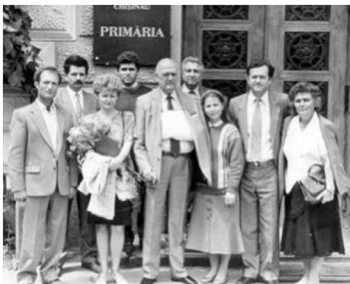
Eugeniu Coșeriu (în centru), cu ocazia conferirii titlului de cetățean de onoare al mun. Chișinău