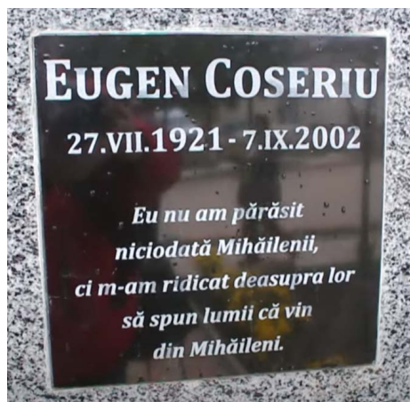
Monumentul lui Coșeriu din satul de baștină Mihăileni