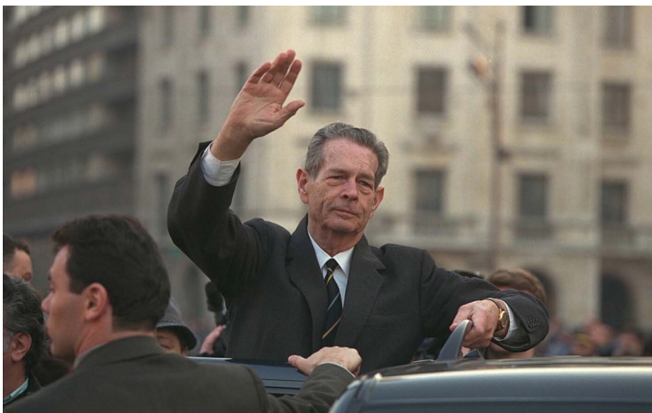
Regele Mihai la vizita din 1992 la Bucuresti, când l-au întâmpinat aproximativ 1 milion de români

p. 291], mai spune Regele Mihai în mesajul de Anul Nou din 1991.