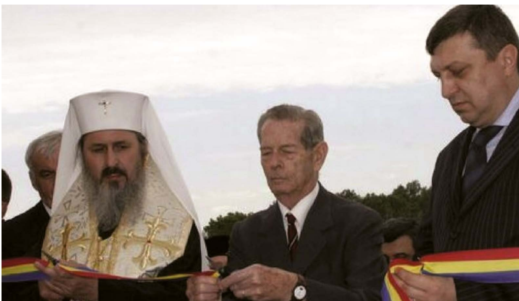
Regele Mihai a participat la inaugurarea cimitirului revalorizat de la Tiganca, 2006

Țiganca și din satele din apropiere”, descrie momentul reîntoarcerii Aliona Grati. [2, p. 153-154]