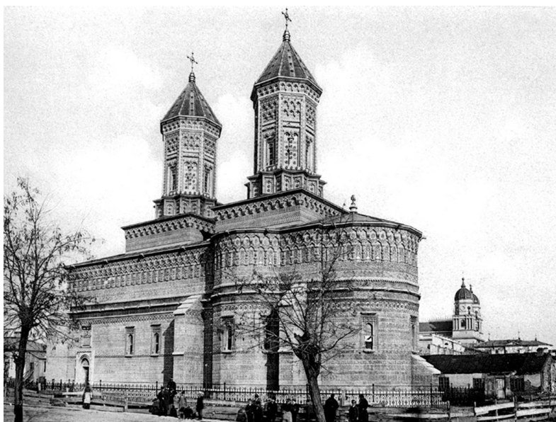
Fig. 2. Biserica Sfinții Trei Ierarhi din Iași

în același timp, în armonie cu acestea. După cum se menționează în raport: „Pereții interiori sunt pictați cu imagini de sfinți, printre icoane sunt multe mozaicuri, multe pictate în al fresco ; catapeteasma este din marmură, cu icoane în mozaic din marmură colorată. Splendoarea ustensilelor bisericești se potrivește pe deplin cu decorația interioară a bisericii.” [3].