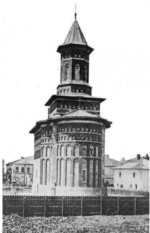
Fig. 3. Biserica Sfântul Nicolae din Iași

După aceasta, excursioniștii s-au deplasat, cu trăsuri special prevăzute, la Seminarul