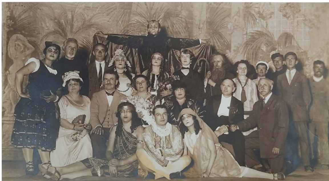
Fig. 1. Spectacolul clasei de operă a Conservatorului „Unirea” prezentat la Teatrul Național, 1927 [23, f. 5].