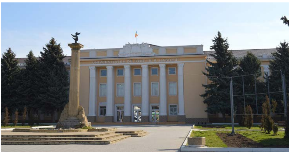
Fig. 9. Clădirea Școlii pedagogice „A.S. Makarenko” (astăzi clădirea Universității de Stat „B.P. Hasdeu”) ( https://www.usch.md/prezentarea-universtitatii/ ).

acoperită cu o cupolă aplatizată. În interiorul acestei săli pot fi văzute coloane corintice, balcoane ornamentate și un plafon cu chesoane. În holul Palatului Artelor se accede prin trei uși de paradă identice. Totuși, proiectul în cauză nu a ajuns la etapa realizării, rămânând doar pe hârtie.