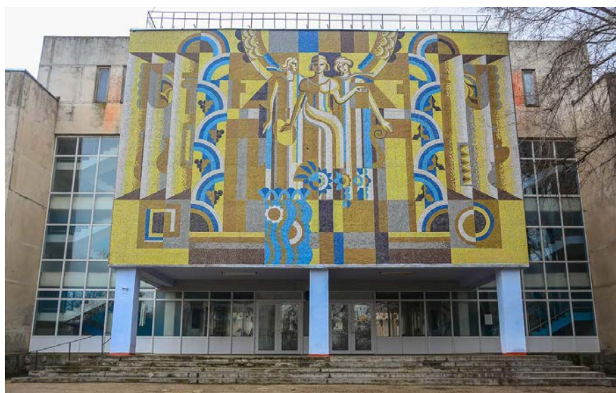
Fig. 10. Mozaicul de pe actuala clădire a Gimnaziului teoretic „S. Rahmaninov” ( https://www.ganasdemundo.com/cahul/ ).

biblioteca, terenurile sportive, sala de festivități, garajele, spălătoria, cazangeria ș.a. Arhitectura clădirilor înalte de 2-7 nivele denotă apartenența la modernismul socialist.