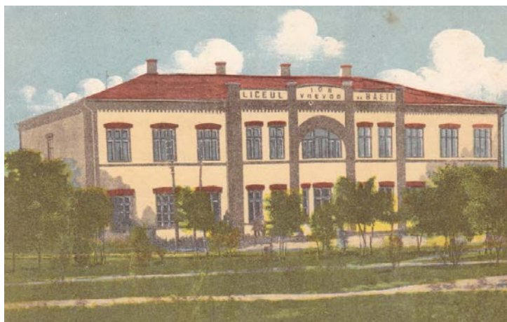
Fig. 4. Liceul de băieți „Ion Voievod” ( http://oldchisinau.com/forum/download/file.php?id=38793&mode=view ).

Printre edificiile noi construite în perioada interbelică se numără clădirea Agenției Bancii Naționale Române (Fig. 5). Fațada edificiului cu două nivele este individualizată prin arcade. Între coloanele cu capitelluri corintice ce susțin