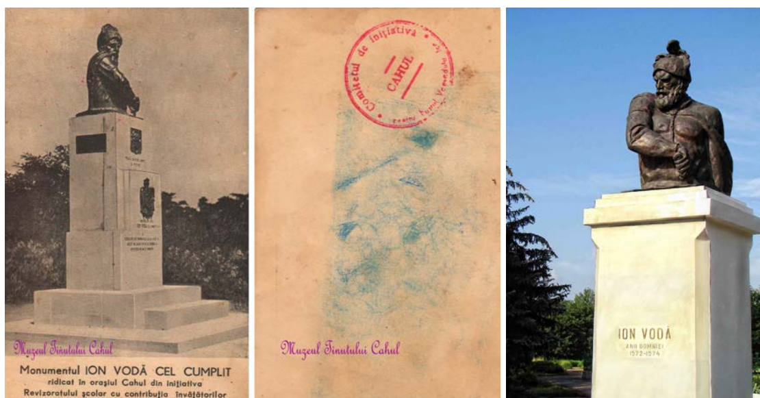
Fig. 6. Monumentului domnului moldovean Ioan Vodă cel Viteaz în perioada interbelică (a) ( http://monumentul.blogspot.com/2014/05/ioan-voda-cel-cumplit-cahul.html ); în 1989 (b).

La mijlocul anilor '30 ai secolului al XX-lea a fost constituit un Comitet de inițiativă pentru crearea monumentului domnului Ioan Vodă cel Viteaz. Din acest Comitet făceau parte revizorul școlar Vasile Hondriță, președintele Asociației Învățătorilor din județul Cahul, pre-