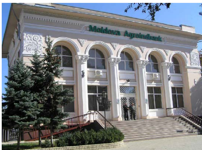
Fig. 5. Clădirea fostei Agenții a Băncii Naționale Române ( http://oldchisinau.com/forum/download/file.php?id=48471&mode=view ).

arcuri în plin cintru se află deschiderile ferestrelor și ușa de paradă. Deasupra coloanelor, în axa acestora, sunt plasate ornamente vegetale reliefate înscrise în triunghiuri, iar colțurile clădirii sunt împodobite cu ornamente vegetale și florale bogate, de asemenea în relief. Sub streșina acoperișului se pot vedea înșiruiți de denticule și un ornament reliefat zigzagat. Clădiri ale băncilor inspirate din același model au fost construite la Huși și la Tighina, dar aici în locul ornamentelor înscrise în triunghiuri au apărut scuturi heraldice înconjurate cu vrejuri, toate în relief.