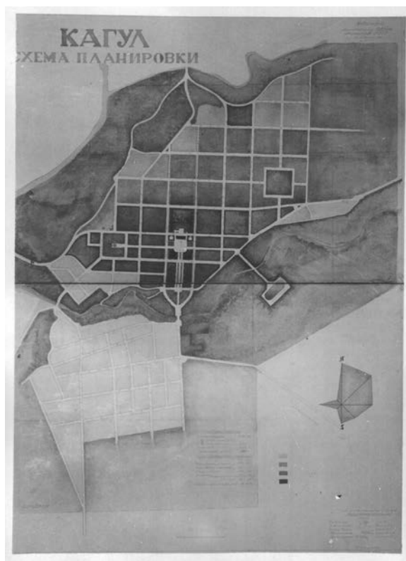
Fig. 7. Schița de plan a orașului Cahul (arhitect V. Smirnov), 1947 ( http://oldchisinau.com/forum/download/file.php?id=22427&mode=view ).

Aceluiași arhitect îi aparține proiectul Palatului Artelor, elaborat în anul 1947. Clădirea cu patru niveluri denotă o arhitectură expresivă de factură neoclasică. Fațada principală este individualizată printr-un portic monumental cu patru coloane corintice, doi pilaștri laterali și un