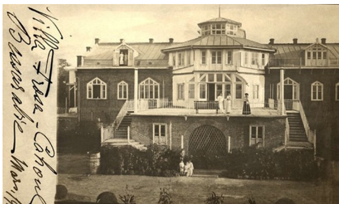
Fig. 1. Conacul proprietarului orașului Cahul, Alexei Caravasile, 1912 ( http://oldchisinau.com/forum/download/file.php?id=12723&mode=view ).

Din documentul de arhivă referitor la construcția unei mici centrale electrice, în anul 1914, de către A. Caravasile, pentru iluminarea