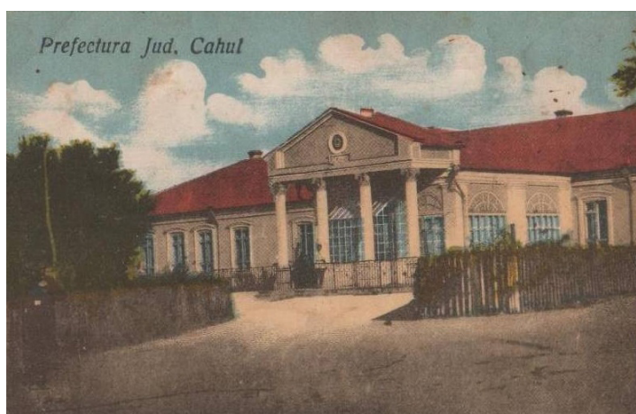
Fig. 3. Clădirea Prefecturii ( http://oldchisinau.com/forum/download/file.php?id=17285&mode=view ).

Administrația Financiară, Primăria și Liceul de băieți. Alte obiective de interes orașenesc prezente pe schiță sunt Poliția, spitalul, cazarma, grădinița de copii nr. 1, școala de băieți nr. 2, Liceul de fete, școala de fete nr. 1, poșta și revizorul. Pe desen sunt indicate Piața Cuza Vodă, Piața cu Târgul de Vite, Piața Nouă și mahalaua lipovenescă.