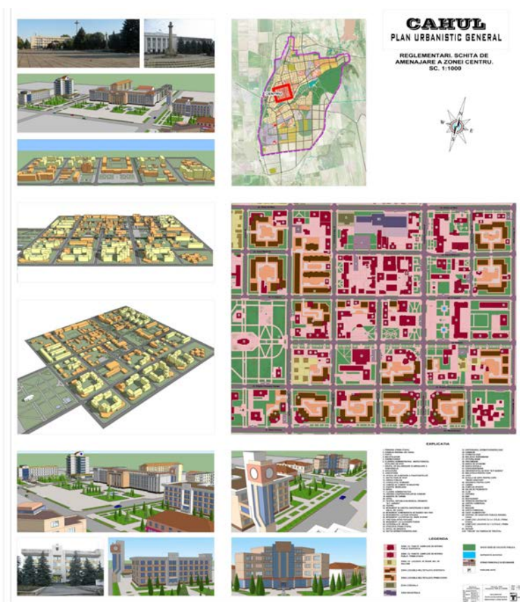
Fig. 11. Planul urbanistic general al orașului Cahul, 2012 (arhitecți Iu. Povar, V. Bocacev) ( https://www.primariacahul.md/index.php/informatii-publice/planul-urbanistic/103-planul-urbanistic-general-al-or-cahul ).

(pentru perspectivă), zona special, cimitirul, zona de utilitate public, agrement și sport, gospodăria silvică, zona de protecție ș.a.