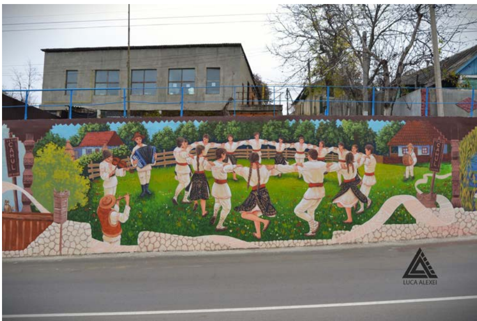
Fig. 12. Pictura murală „Dor de casă”. Fragment (pictor A. Luca) (foto A. Luca).

Astăzi, orașul Cahul include următoarele sectoare urbane: Focșa și Valincea (la nordul așezării), Centru (în centrul așezării), Lipovanca (în sud-vestul așezării) și Lapaevca (în sudul așezării). Sectoarele sunt divizate de rețeaua stradală după principiul „hippodamic”. În partea de vest a urbei trece linia de cale ferată. Principalele artere de tranzit sunt șoseaua Șcheia – Bd. Republicii – str. Dunării – șoseaua Griviței (duce spre orașele Giurgiulești și Chișinău), str. Ștefan cel Mare și Sfânt (duce spre orașul Taraclia), str. Mihai Viteazul (duce spre orașul Vulcănești) și Șoseaua Prieteniei (duce spre România). O arteră de ocolire – centura Cahul trece pe lângă linia de cale ferată. Alte străzi de interes orășenesc sunt str. Ivan Spirin și str. B.P. Hasdeu. Zona industrială și comunală a urbei sunt concentrate, în mare parte, la marginile