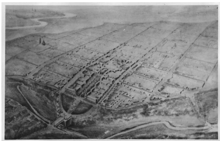
Fig. 8. Perspectiva orașului Cahul (arhitect V. Smirnov), 1947 ( http://oldchisinau.com/forum/download/file.php?id=22426&mode=view ).

fronton triunghiular. Pe fronton sunt înfățișate siluete umane reliefate ce au o anumită tangență cu artele. În calitate de elemente arhitecturale dezvoltate pe orizontală sunt folosite cornișele, cordoanele și panourile reliefate între ferestrele parterului și etajului. Sala de spectacole este