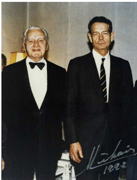
Regele Mihai și Ion Rațiu în 1992

Contextul în care a fost realizat acest interviu, în vara anului 1989, este legat de atenția presei internaționale care se îndreaptă asupra regelui Mihai, exilat la Versoix. Regele primește jurnaliștii (de exemplu, pe Frédéric Mitterand, pentru televiziunea franceză TF1 și pe Sugár András, din partea televiziunii maghiare MTV) care îl întrebă despre starea de fapt din România, dar și despre perspectivele revenirii sale în România. Înregistrările au fost realizate în zilele de 17, 18, 19 și 20 iulie, la Versoix. Interviul acordat Televiziunii Maghiare, care a fost difuzat în emisiunea Panorama, are o importanță deosebită și datorită apropierii în timp de evenimentele din decembrie 1989 (interviul a fost difuzat într-o formă prescurtată în 31 iulie 1989 și pe larg