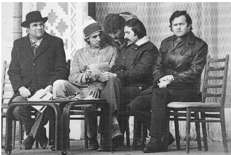
Unul din primele mitinguri ale mișcării democratice la Teatru de Vară din iarna anilor 1988–1989.