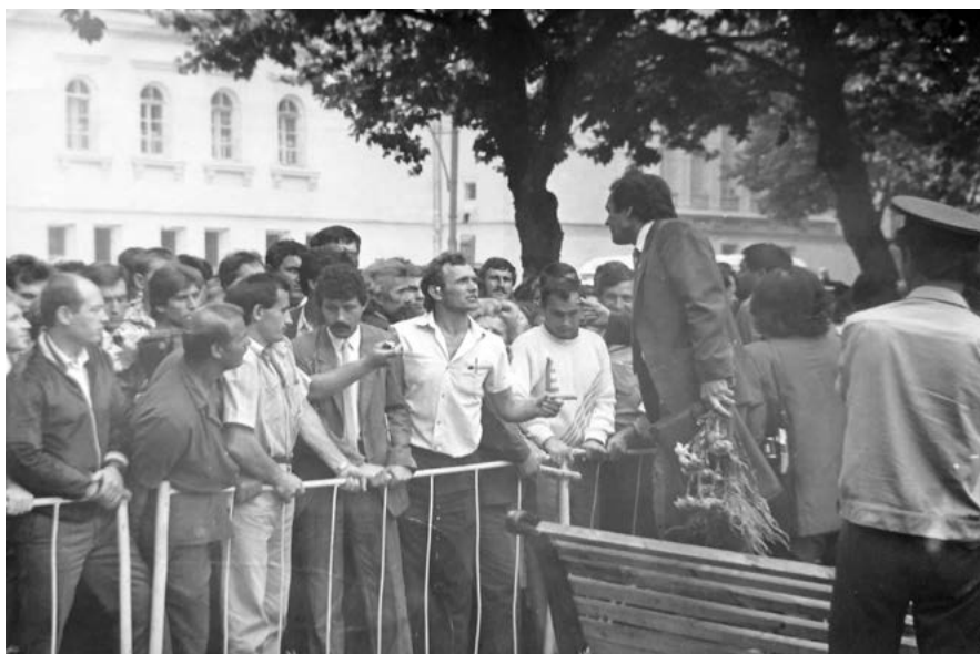
Criza din fața Teatrului de Operă, pe 31 august, în timpul desfășurării Sesiunii a XIII-a a Sovietului Suprem al RSS Moldovenești

cei trei stâlpi pe care se ține neamul ” (s.n) [3, p. 110-111]. Un tablou exact al stării de lucruri, finalizat cu un aforism antologic!