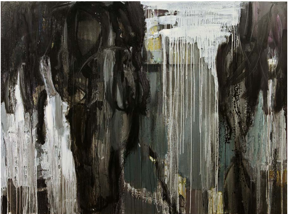
Trecere , 2019, 1500×2000 mm, acril, pânză.