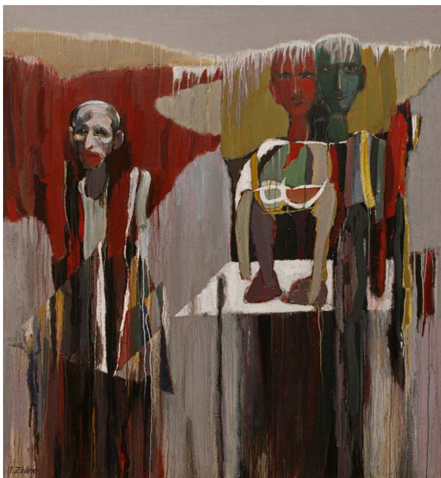
Detașare , 2019, 1500×1400 mm, acril, pânză.

celor trei chipuri, ochii stinși, buzele cu colțurile lăsate a mare tristețe, rapelurile de roșu sângeri în masa de alb-gri, euritmia liniilor verticale ce desemnează nasul axial, intersectat cruciform de linia arcadelor, accentuează dramatismul sfâșietor al imaginii ce te urmărește, obsedant. În Dispersie (2018), cele trei chipuri par multiplicare prin culoarea lichidă lăsată să curgă ca o ploaie asupra lor, conferindu-le indecizie formală, virbatilă. Tragismul lor este accentuat de mărirea cantității de roșu. În Trecere (2018) apelează la efecte gestualiste de tip Pollock, însă lipsite de violență, ca descărcarea de nervi a artistului american ci, mai degrabă, ca o mângâiere duioasă a pânzei de care Zbârnea este îndrăgostit. Sacrificiu (2018) se prezintă ca o evocare a chipurilor fragmentare din frescele paleocreștine ale catacumbelor romane.