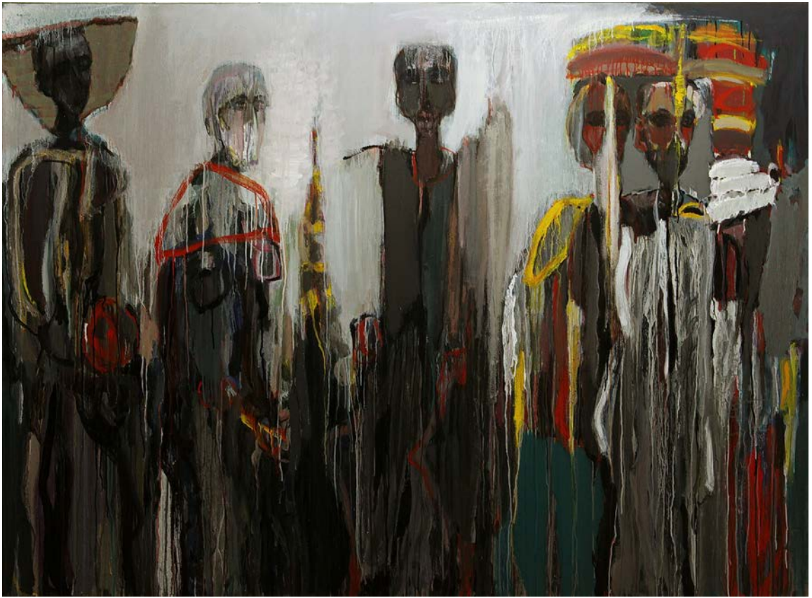
Revenire IV , 2019, 1500×2000 mm, acril, pânză.