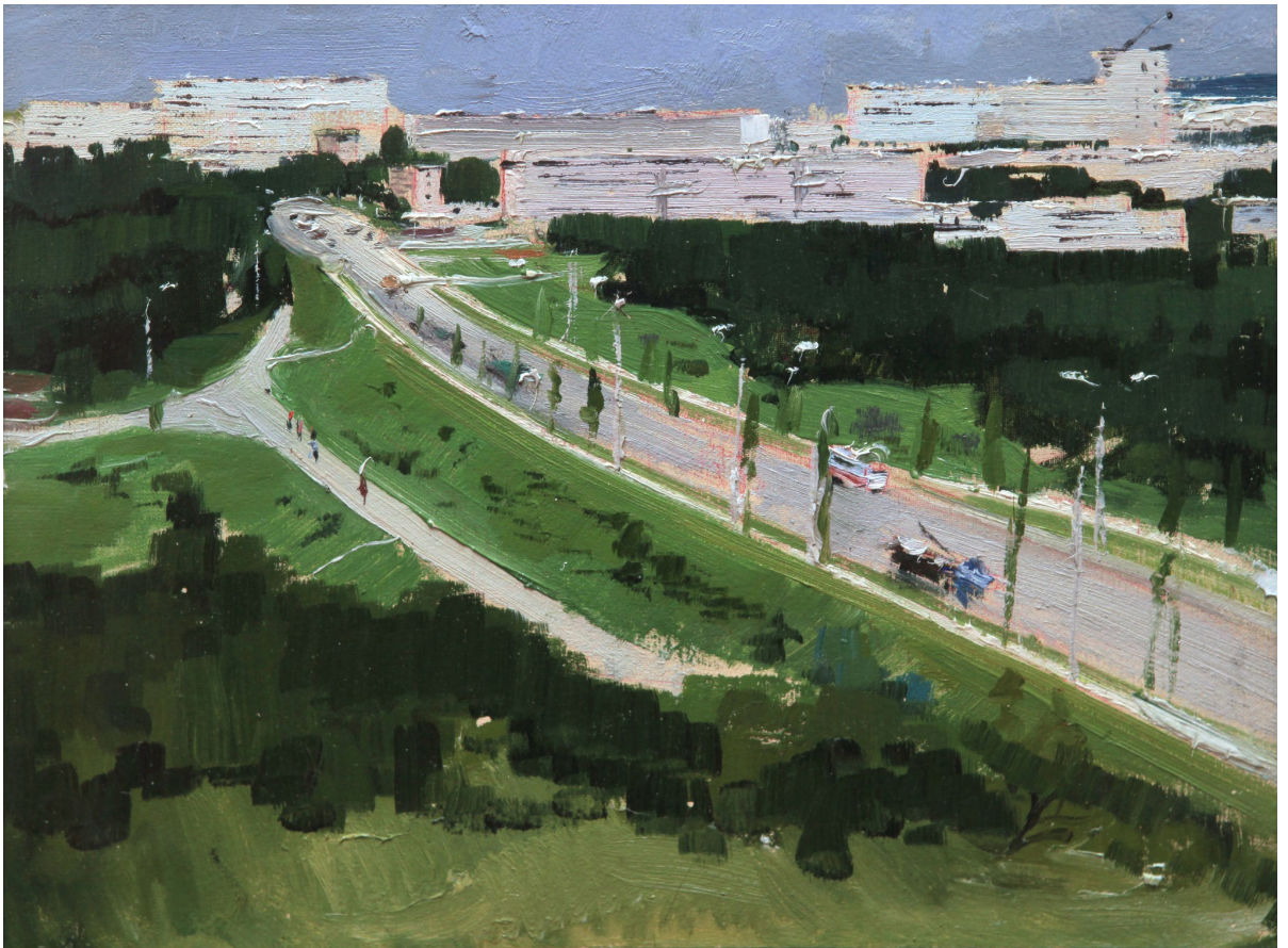
Chișinăul în construcție. Sectorul Râșcani, 1980, ulei, carton, 250×347 mm, MNAM [4].