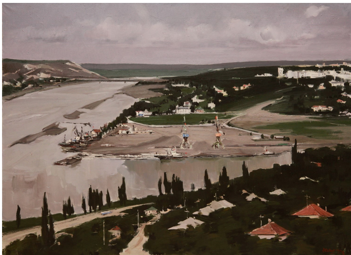
Portul de la Râbnița, 1978, 1000×1400 mm, MNAM [4].

ulei, carton, 250×347 mm, MNAM) și „Râșcanii reînnoiți” (1980, ulei, carton, 240×320 mm, MNAM), autorul prezintă un oraș, pe de o parte, cu multe spații verzi, iar pe de altă parte, unul modern, reconstruit. Pictura „Râșcanii reînnoiți”, compoziția căreia este formată din linii oblice și orizontale, este dominată de vegetația de un verde intens și de imensele edificii albe. Atmosfera unei zile însorite este întreruptă de norii expresivi, de nuanțe gri. Motivul similar în „Chișinăul în construcție. Sectorul Râșcani” reprezintă o zi însorită în plină vară, cu soare intens și cerul senin. În acest caz, Iurie Șibaev aplică pensulațiile expresive decorative, menținând contrastul tonal alb-gri cu verdele închis. Carosabilul care străbate diagonala pânzei este amenajat cu corpuri de iluminat stradal, puiți plantați ș.a., făcându-se referință la existența unui plan general urbanistic.