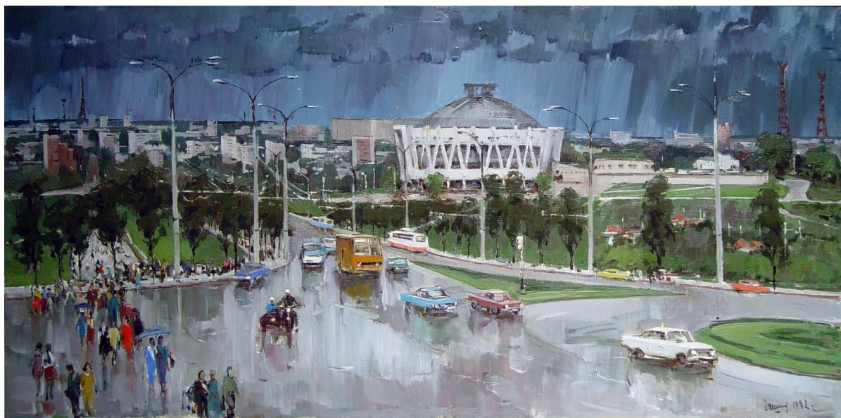
După ploaie , 1982, ulei, pânză, 1000×2000 mm, MNAM [4].

locuitorilor capitalei. Lucrul acesta este exprimat de lucrare, vedem aici prezența a zeci de oameni. Tușele dinamice de un albastru-gri închis ale cerului oferă gravitate pânzei. Monocromia blocurilor locative este diluată de petele colorate ale hainelor oamenilor și ale transportului public.