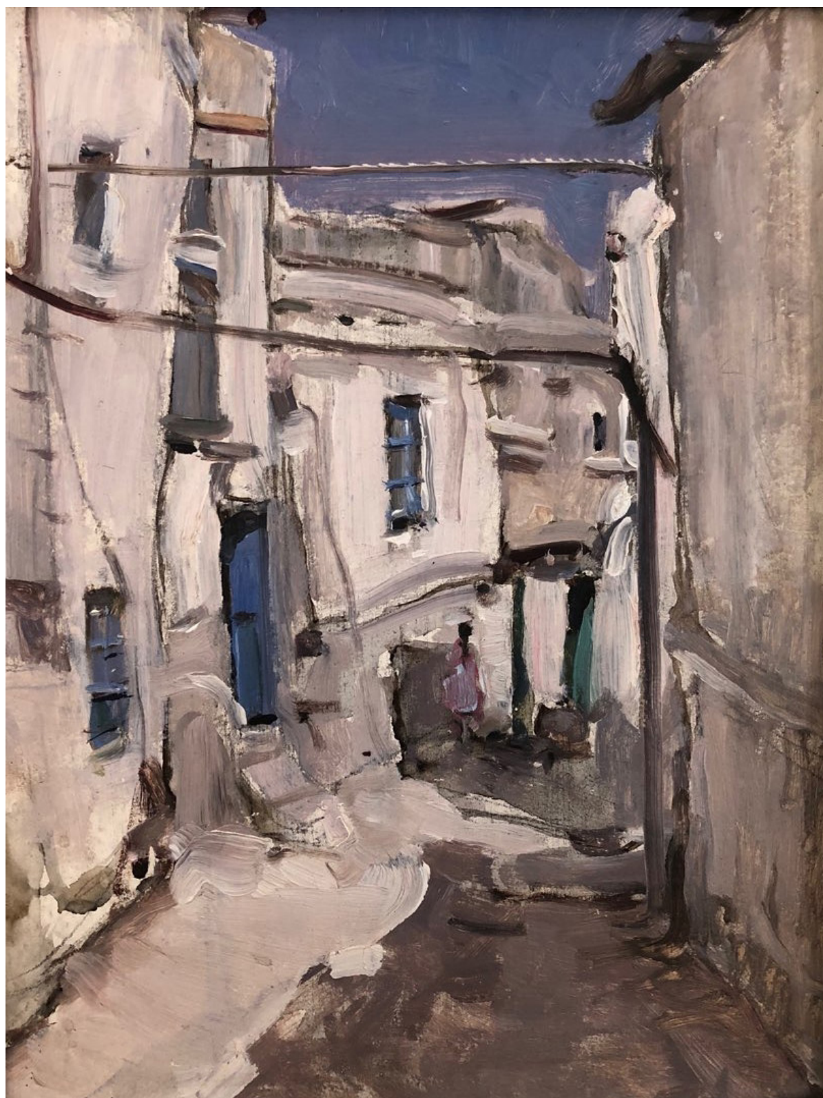
Chișinău vechi, colecție particulară.