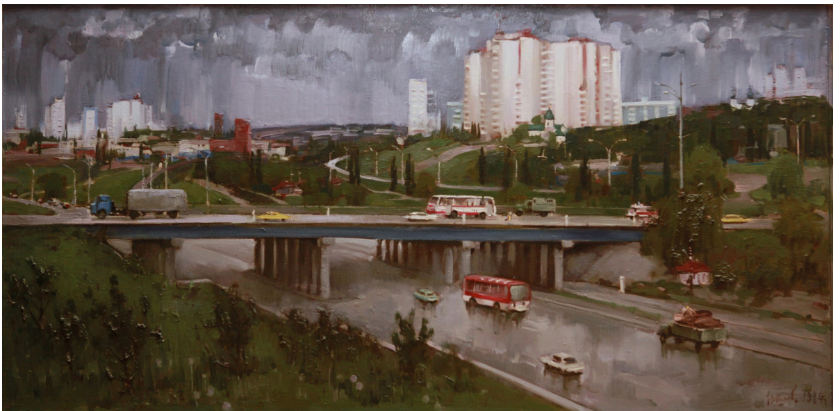
Noul Chișinău, 1983–1984, ulei, pânză, 1000×2000 mm, MNAM [4].