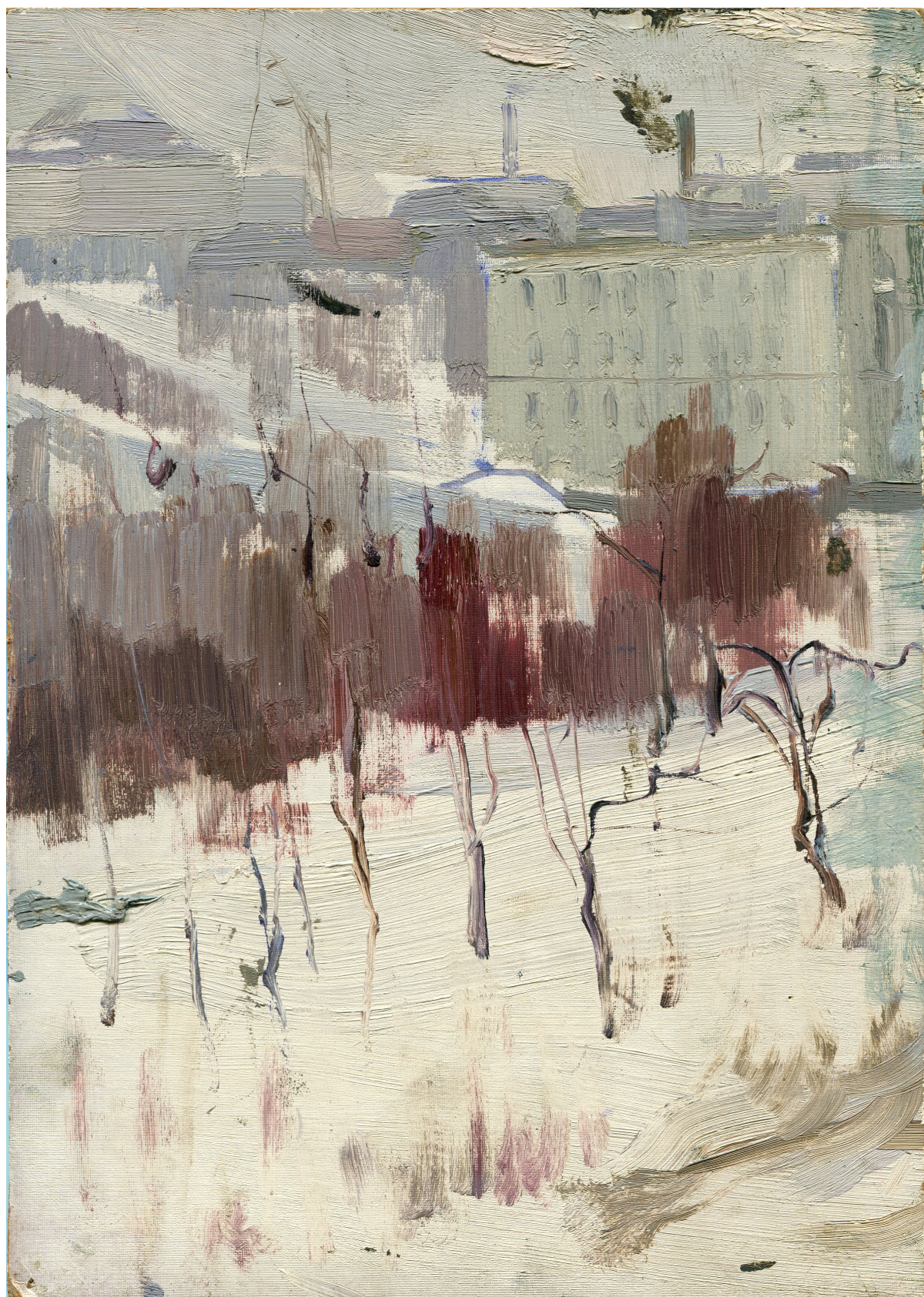
Peisaj de iarnă. Chișinău. Buicani, 1974, ulei, carton, 205×285 mm [5].