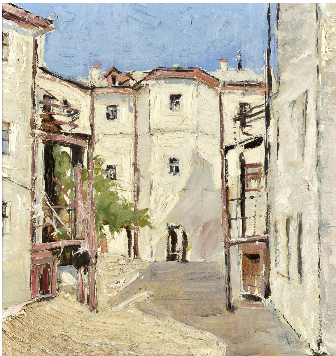
Chișinăul vechi , 1971, ulei, carton, 265×250 mm [5].