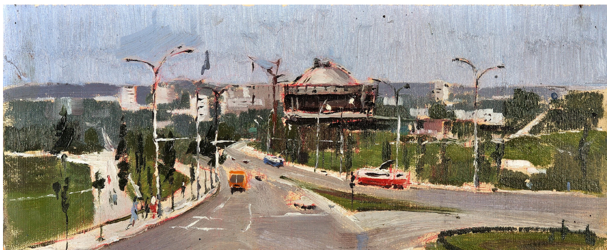
Circ , 1982, ulei, carton, 140×345 mm, MNAM [4].