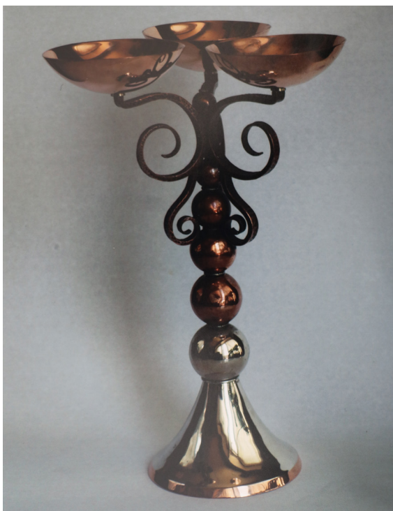
Vasili Șochin, Sfeșnic, cupru, alpaca, forjare, 2007, 290×180 mm, dosarul personal UAP.

A folosit filigranarea pentru a realiza o altă cupă pentru vin, expusă la Bienala Internațională de Artă Decorativă (Chișinău, 2012, ediția a II-a). O altă cupă a fost expusă la cea de-a III-a ediție a Bienalei Internaționale de Artă Decorativă (Chișinău, 2014), iar o cupă fusese prezentată de V. Șochin la „Autumnala – 2014”. „Cupa pentru vin” (2010; 230×110 mm) este confecționată din argint german, smarald, jasp, filigran, email.