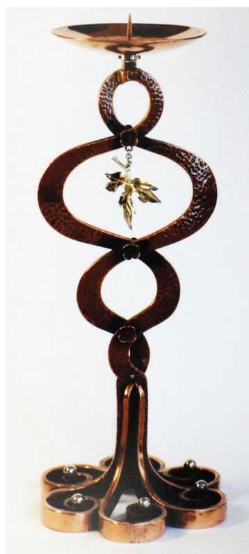
Vasili Șochin, Sfeșnic, argint german, cupru, 2004, 230×210 mm.

cupelor decorative a rămas văduvit și complet neacoperit.