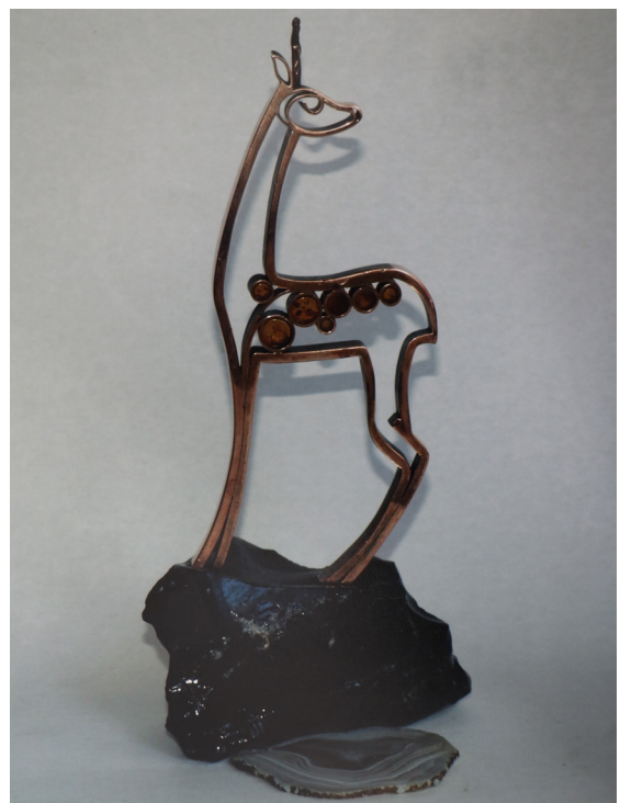
Vasili Șochin, Sfeșnic Cerb , cupru, chihlimbar, obsidian, forjare, 2008, 230×100×60 mm, dosarul personal UAP.