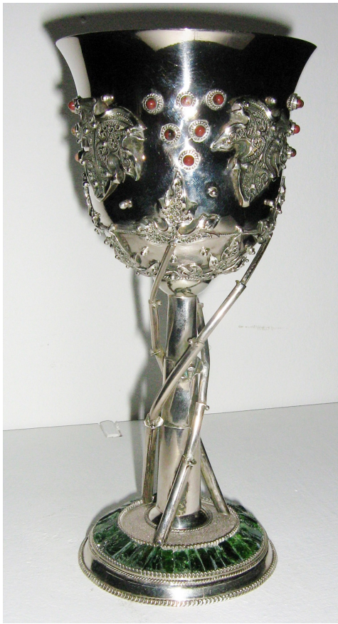
Vasili Șochin, Cupă pentru vin , argint german, smarald, 2010.

Un loc aparte în creația lui V. Șochin revine unui superb platou decorativ cu diametrul de 210 mm (2008), pentru care maestrul a folosit cupru, alamă, tombac, forjare, filigranare [9, p. 146-152]. Elementele decorative emailate conferă articolului o deosebită eleganță și rafinament.