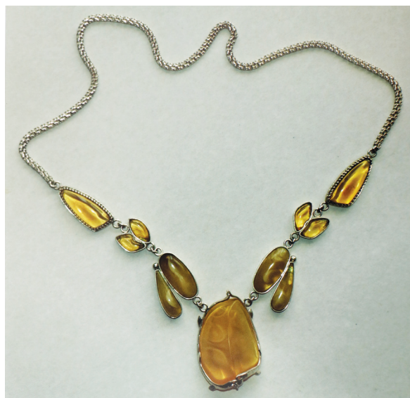
Vasili Șochin, Colier , argint, chihlimbar, filigran, 2011, 200×20 mm, colecție privată.

*Articolul este elaborat în cadrul Programului de Stat 20.80009.0807.19 Cultura promovării imaginii orașelor din Republica Moldova prin intermediul artei și mitopoeticii .