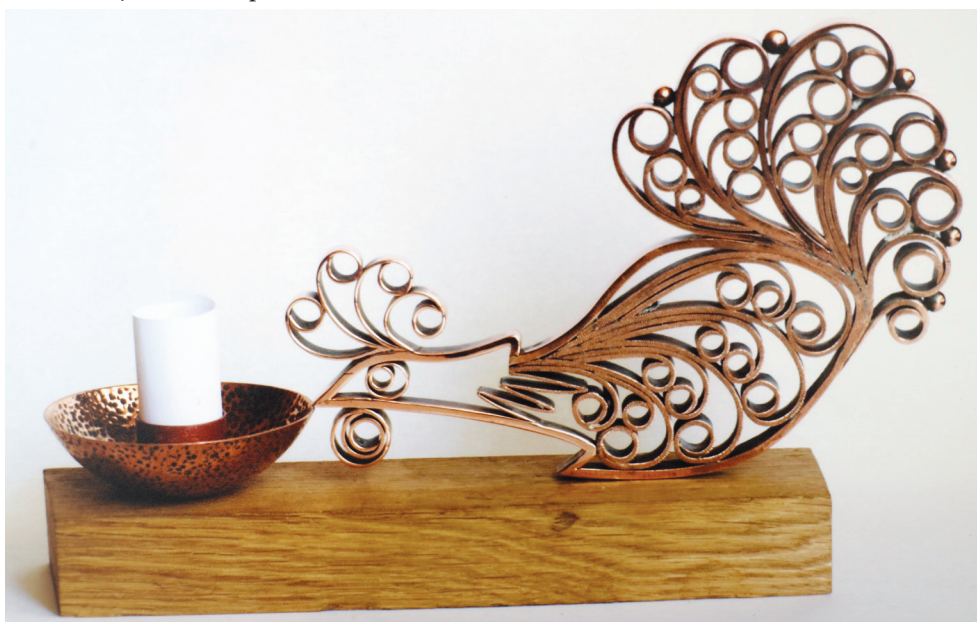
Vasili Șochin, Sfeșnic Cocos , 2007, colecție privată.