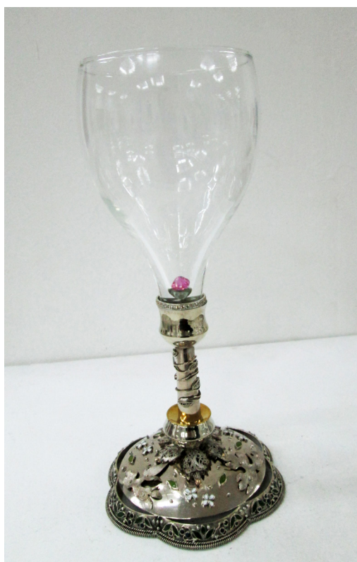
Vasili Șochin, Cupă decorativă Toamna de aur , 2014, colecție privată, foto L.C.