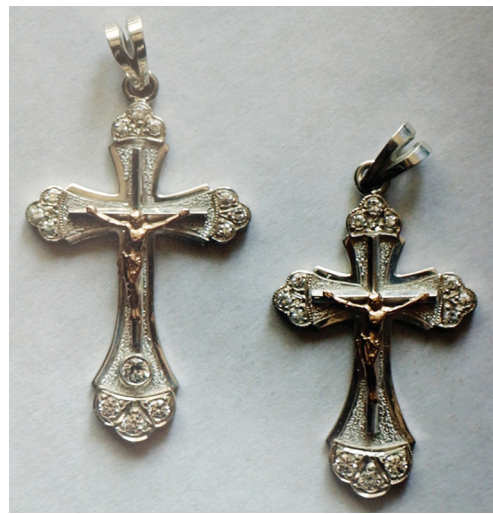
Vasili Șochin, Cruciulițe de botez , aur, argint, zirconiu, 2008, 48×32 mm; 42×28 mm.

În opinia noastră, cea mai relevantă ca soluție plastică și rezolvare tehnologică este cupa de vin „Toamna de aur” (2014; înălț.: 250 mm, diam.: 119 mm), pentru care regretatul V. Șochin a folosit argint, alpaca, inserții de zirconiu [9, p. 146-152]. Paharul cupei este din sticlă. Ca