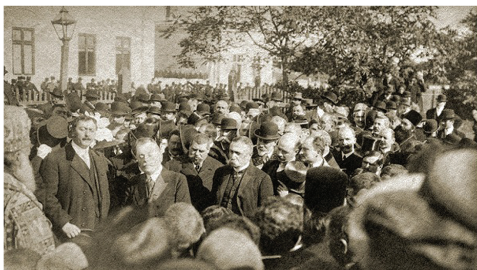
Buzău, 6 octombrie 1911, C.C. Arion a fost prezent alături de Alexandru Marghiloman la ceremonia de punere a pietrei fundamentale a clădirii internatului „Ion Marghiloman”, pentru elevii Liceului „Alexandru Hasdeu”, imobil ce astăzi este sediul Liceului de Arte „Margareta Sterian”.

Cel de-al doilea Guvern, condus de Titu Maiorescu (14 octombrie 1912 – 11 decembrie 1913), în care Alexandru Marghiloman a deținut portofoliul finanțelor, iar C.C. Arion – pe cel al agriculturii și domeniilor, a fost unul dintre primele executive de succes ale țării, prin creșterea