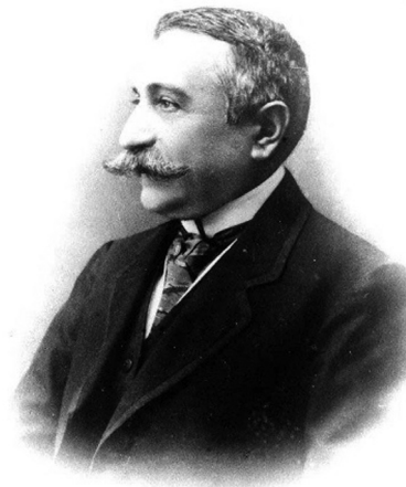
Constantin C. Arion

Constantin C. Arion, în 1878, și-a luat doctoratul la Paris cu teza De la puissance paternelle à Rome, en France et en Roumanie, (Despre puterea paternă a Romei în Franța și România) , după care s-a întors în țară ca procuror și jude-