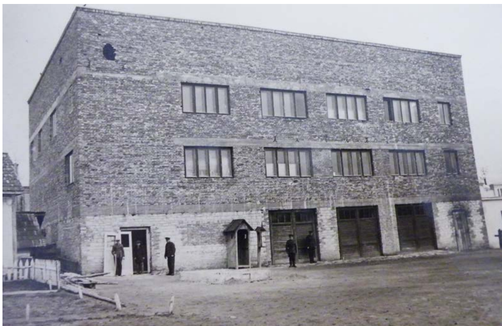
Clădirea nouă a Pompieriei [67, f. 16].

comuniste din județul Bălți și despre reacția administrației locale: s-au întreprins arestări, cu confiscarea literaturii comuniste [58, p. 4].