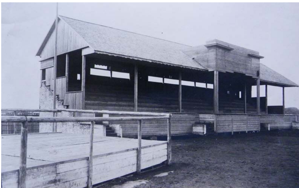
Tribuna Stadionului din Bălți [67, f. 78].

investit la sfârșitul anului 1935. Pe 10 ianuarie 1935, Ziarul relatează: