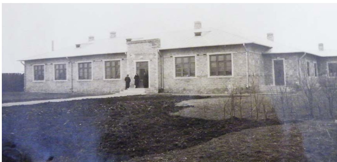
Școala nouă din cartierul Slobozia [67, f. 88].