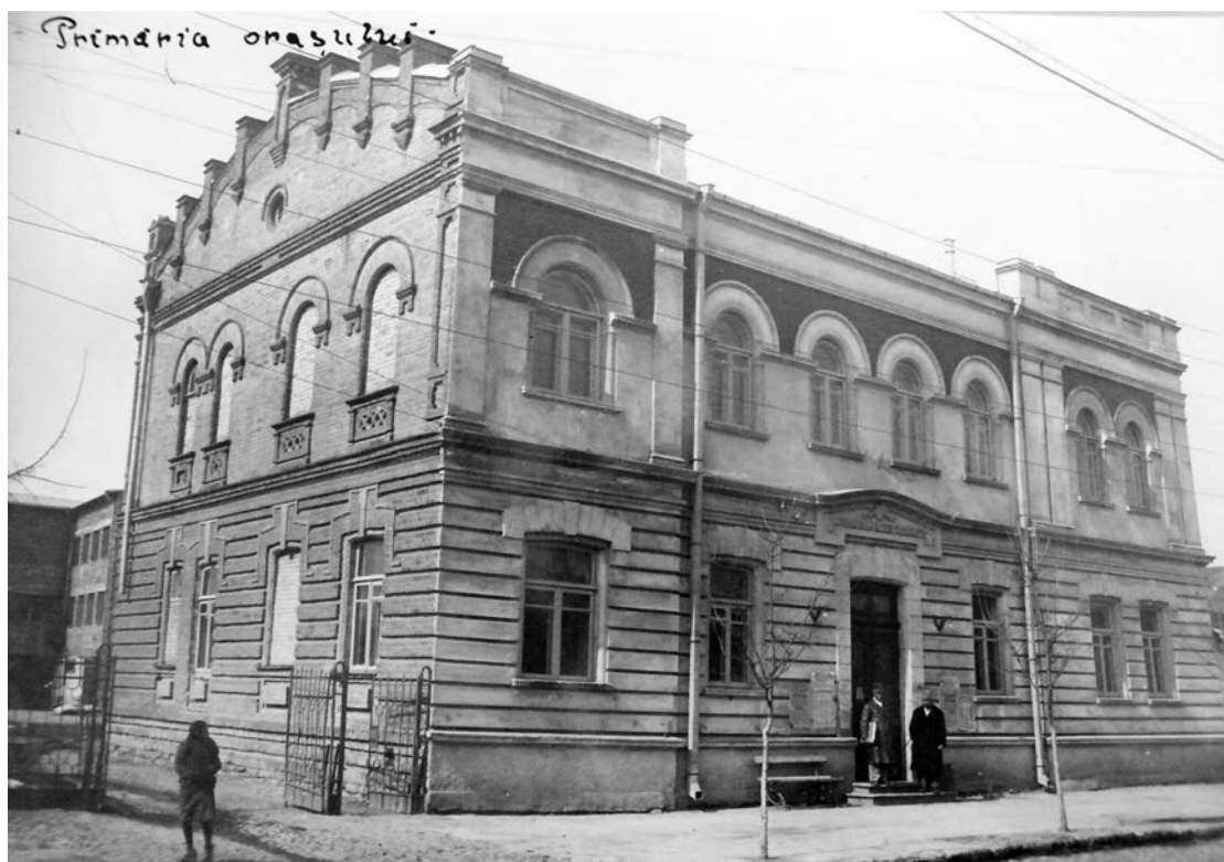
Edificiul Primăriei orașului Bălți [67, f. 11].