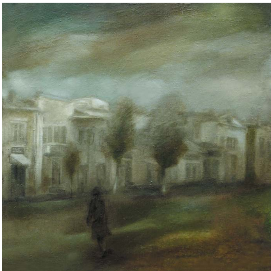
Vânt în piața veche, 1976, ulei, pânză