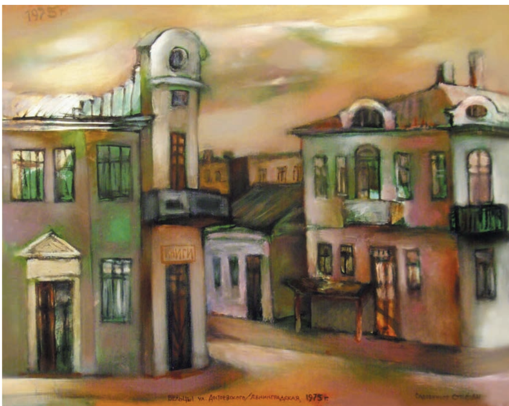
„Dominanta intersecției”, 1975, ulei, pânză