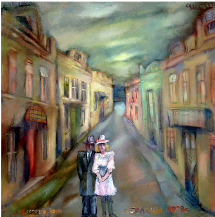
„Plimbare”, 1978, ulei, pânză