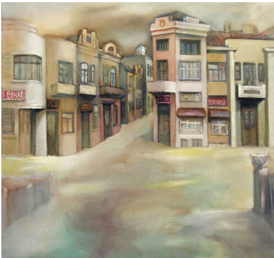
„Trecutul luminos”, 1981, ulei, pânză