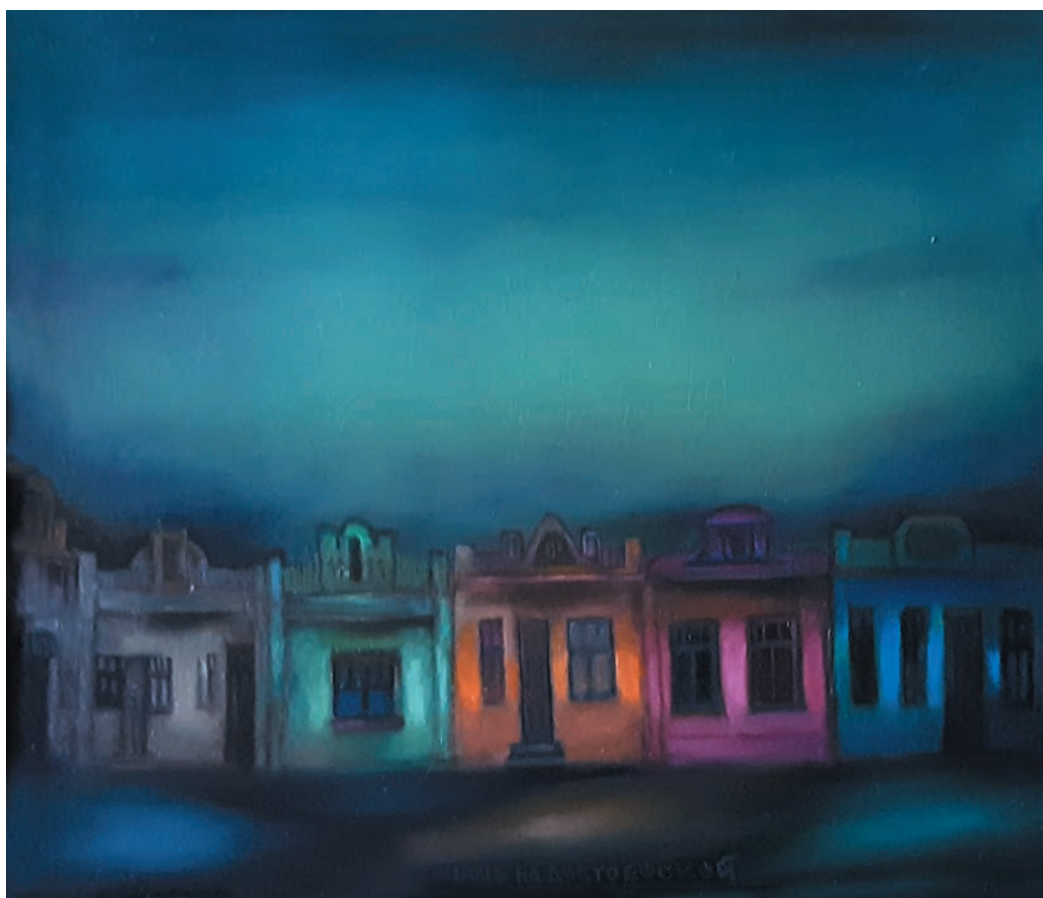
„Iluminatul străzii”, 1984, ulei, pânză