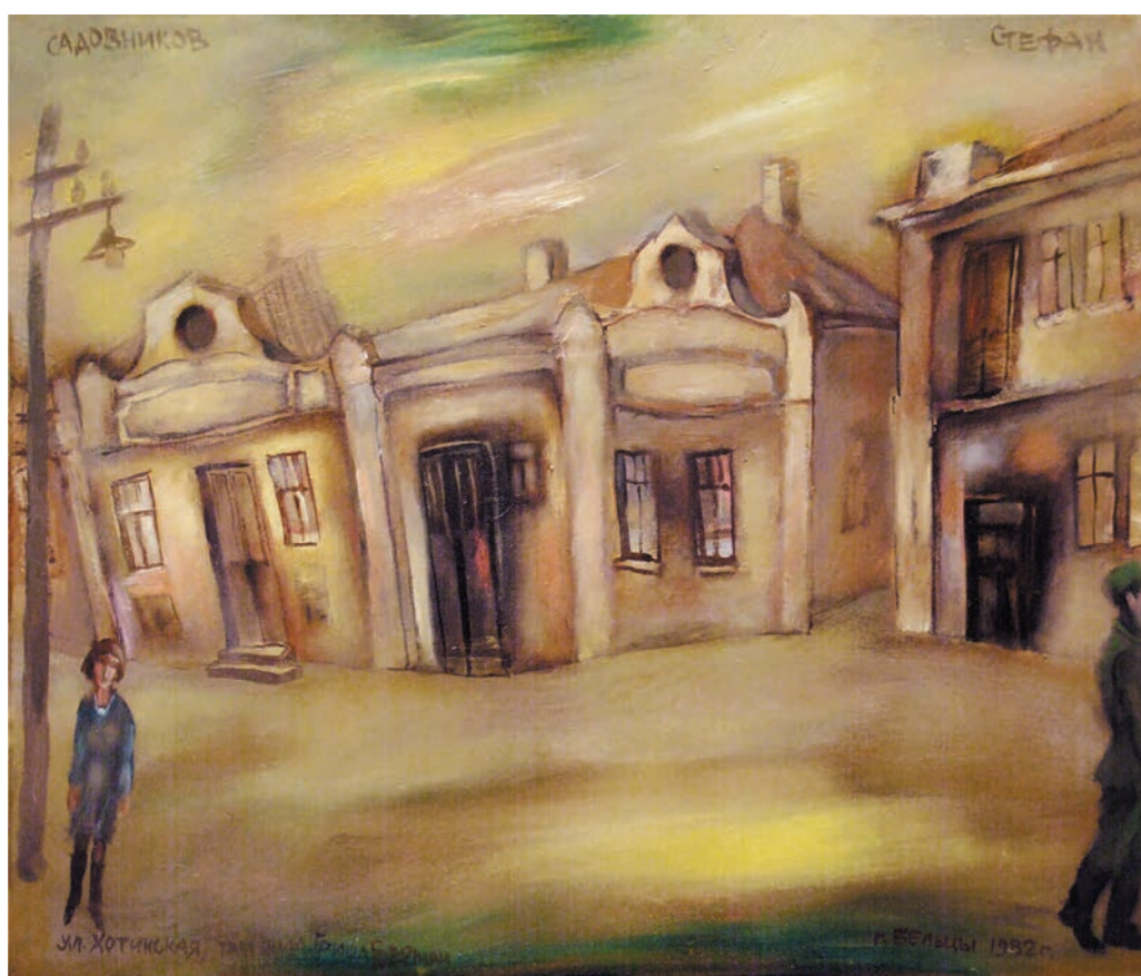
„Strada dansând”, 1982, ulei, pânză