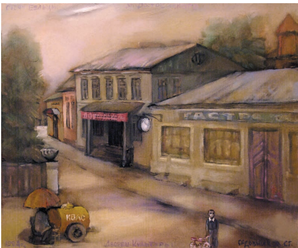
„Moleșeala verii” 1984, ulei, pânză