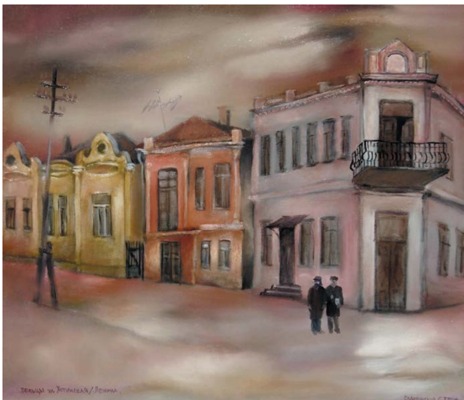
„Sub balcon”, 1983, ulei, pânză