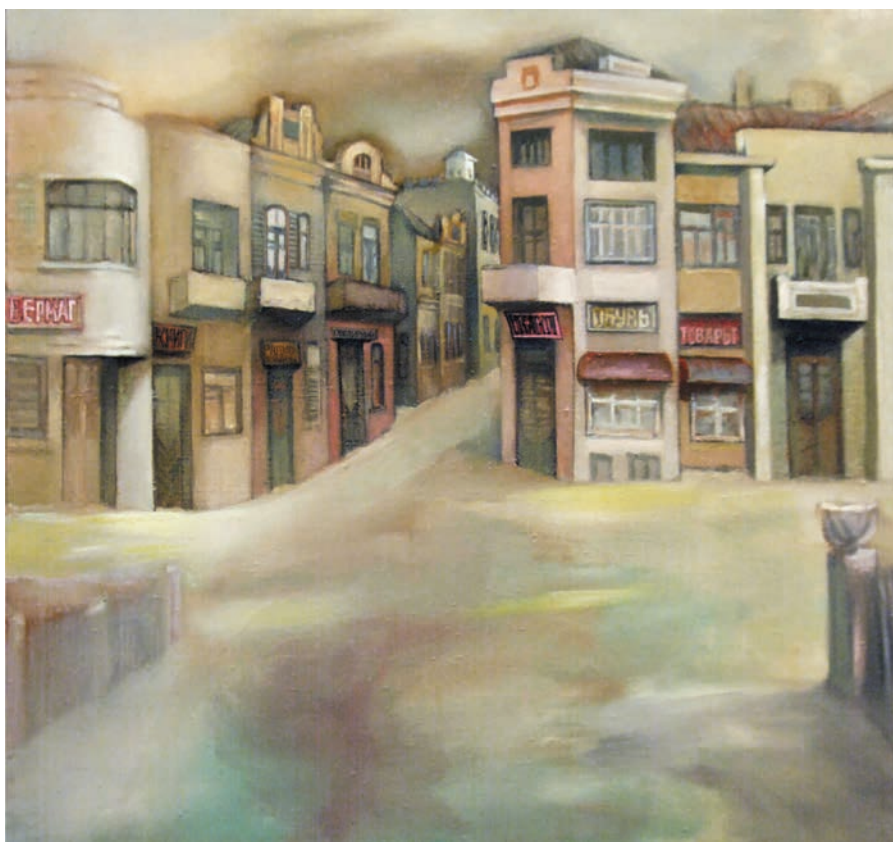
„Trecutul luminos”, 1981, ulei, pânză