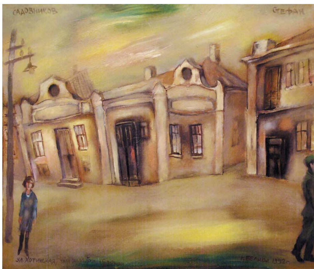
„Strada dansând”, 1982, ulei, pânză