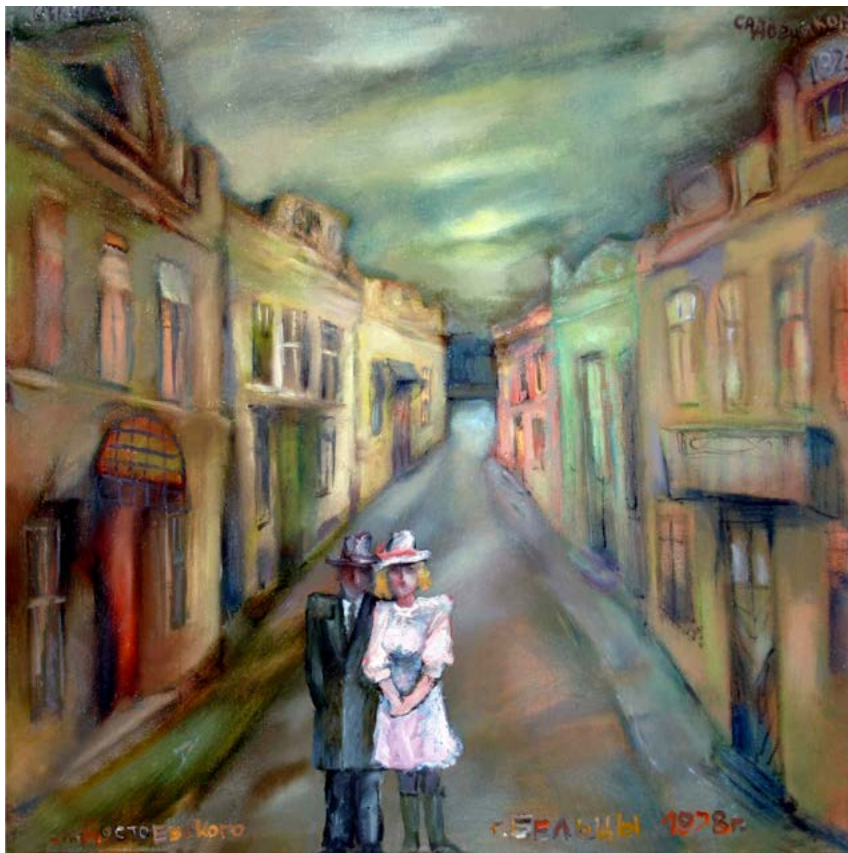
„Plimbare”, 1978, ulei, pânză

povestea ei. Casa studentului Grișa care a fugit peste hotare pentru totdeauna este delăsată, iar tânăra din prim-plan este „în așteptarea fericirii care nu va veni” [11, p. 32].