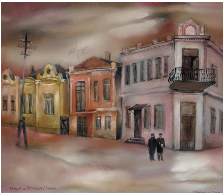
„Sub balcon”, 1983, ulei, pânză