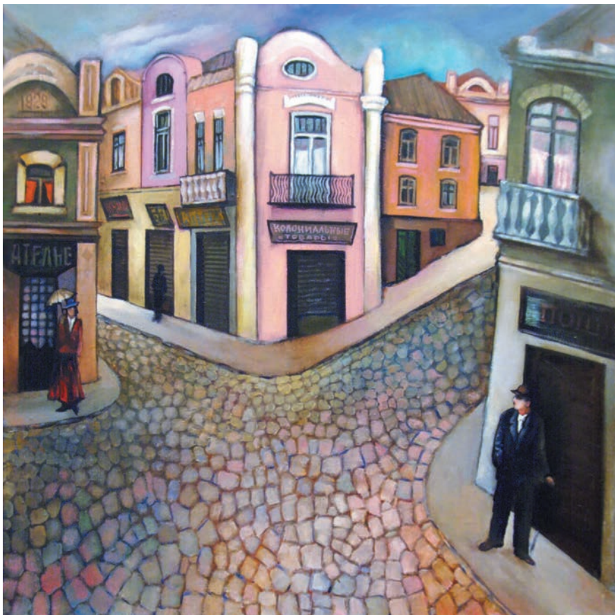
„Romantica trecutului”, 1982, ulei, pânză