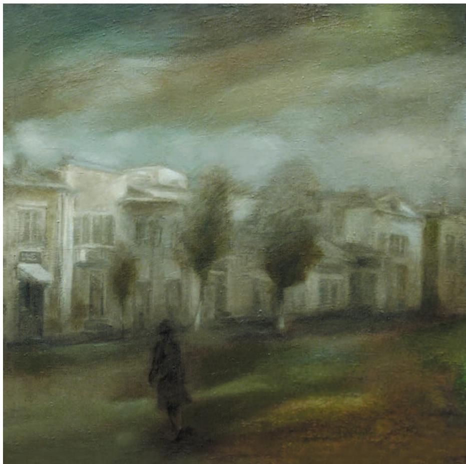
Vânt în piața veche, 1976, ulei, pânză