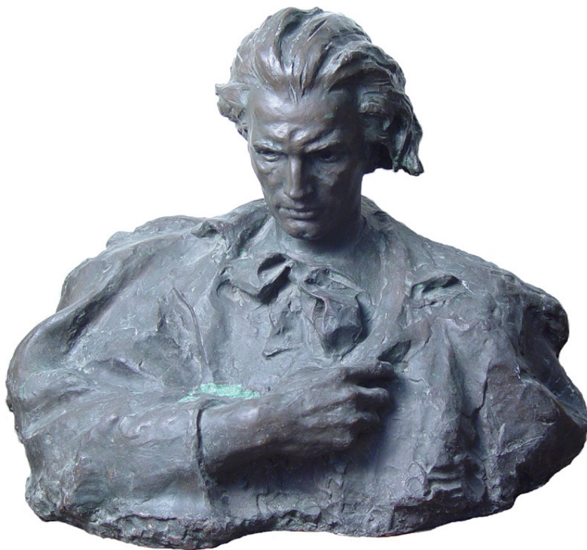
Lazăr Dubinovschi. Mihai Eminescu , 1957. Muzeul Național de Artă al Moldovei.

România și cealaltă – la Muzeul Național de Artă din Chișinău. A decedat la 29 noiembrie 1982, în Chișinău.