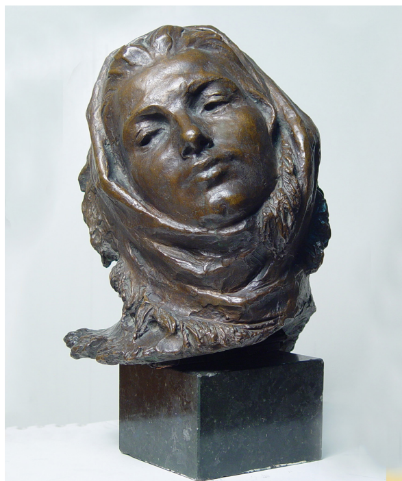
Lazăr Dubinovschi. Florica , 1955. Muzeul Național de Artă al Moldovei.