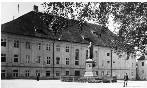
Fig. 4. Gimnaziul evanghelic.

În 1796 se demola bastionul Cisnădiei, pentru a face loc unei cazărmi de infanterie [7, p. 6], dată în folosință în 1807.