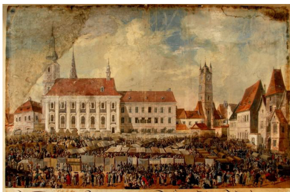
Fig. 1. Târg la Sibiu. Pictură de Franz Neuhauser cel Tânăr (1789).

În acest timp, majoritatea locuitorilor o formau cei de condiție medie: mici proprietari de terenuri agricole, calfe și ucenici lucrând în bresle, negustori (și ei organizați în bresle), pastori luterani și preoți catolici, cămătari, învățători, mai puțini medici, juriști, artiști. Toți erau oameni liberi, dar granițele sociale erau