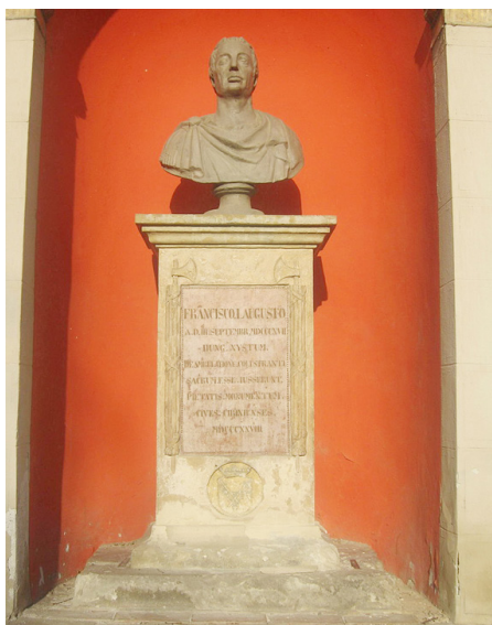
Fig. 9. Bustul împăratului Francisc.

acestui în oraș (unde a fost prezent în 1817) [3, p. 38]. Este un proiect inițiat și supervizat de către Franz Neuhauser cel Tânăr și se acomodează întocmai cu stilul său pictural.