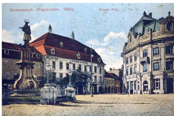
Fig. 8. Statuia lui Nepomuk. În spate, Casa Albastră și în continuare, Palatul Brukenthal.

acestui în oraș (unde a fost prezent în 1817) [3, p. 38]. Este un proiect inițiat și supervizat de către Franz Neuhauser cel Tânăr și se acomodează întocmai cu stilul său pictural.