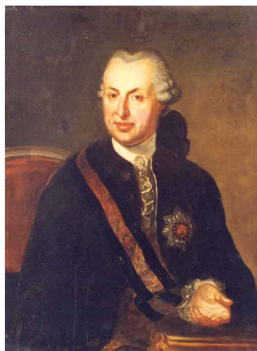
Fig. 10. Samuel von Brukenthal.

Așa cum națiunile stau sub semnul astral al unor mari personalități culturale (cu care se identifică și politic, și spiritual) și comunitățile locale au beneficiul real al unor personalități excepționale, pe care le amplifică în timp, până la mitizare, pentru Sibiu, acest simbol fără de care comunitatea își pierde chiar identitatea este baronul Samuel von Brukenthal.