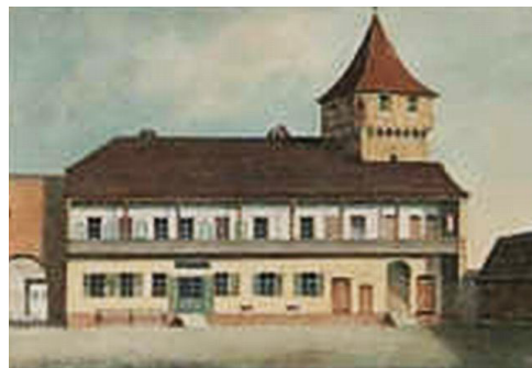
Fig. 6. Clădirea teatrului ridicat de Martin Hochmeister desenată de Johann Böbel.