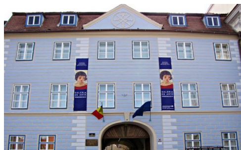
Fig. 3. Casa Albastră. Fotografie contemporană.

Un alt reper al centrului baroc a devenit „Casa Albastră” din Piața Mare, unde proprietarul, baronul von Möringer, a făcut modificări substanțiale la parter și a ridicat un nou etaj, în stil baroc târziu. La fel ca toate clădirile publice, frontonul unghiular care încheie fațada, păstrează stema orașului