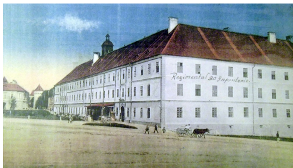
Fig. 5. Cazarma de infanterie. Poză interbelică.