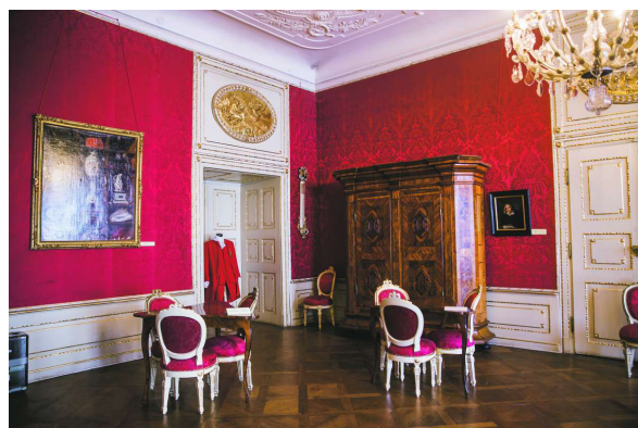
Fig. 11. Interior baroc în Palatul Brukenthal.

Palatul a jucat și rolul de gazdă centrală a muzicii de cameră sibiene. Un „collegium musicum” prezenta acolo triouri și cvartete de