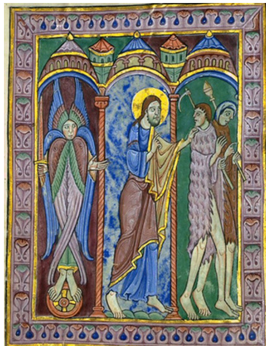
Fig. 5. Miniatură din Psaltirea Albani [20].

Am citat doar câteva exemple dintr-un număr considerabil de monumente medievale. Credem că mărturiile sunt suficiente pentru a demonstra existența unor constante, în imaginarul medieval, privind începuturile muncii pământești. Unele reprezentări relevă suferințele pe care le aduce munca pământească. În același timp, munca asigură mijloacele necesare pentru a păstra viața. Uneltele de muncă și ocupațiile apar drept un dar al Creatorului. În majoritatea imaginilor amintite, cele mai vechi îndeletniciri umane, din vremea lui Adam și Eva, le constituie prelucrarea pământului și țesutul. Vechimea biblică le conferă ocupațiilor