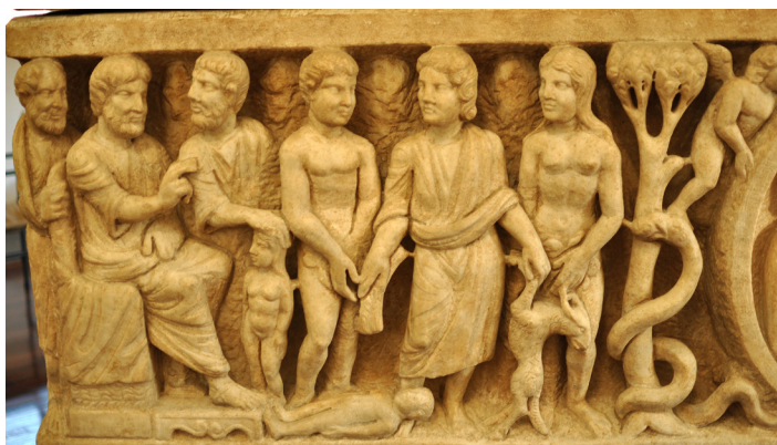
Fig. 1. Sarcofagul Dogmatic (c. 320–350).

lului al XIII-lea. În scena ce urmează izgonirii din Paradis, Adam prășește, iar Eva e așezată pe o moviliță, cu un fus în mână (Fig. 2). Fețele triste ale celor două personaje sugerează regretul pentru Paradisul pierdut, precum și povara muncii pământești. O altă scenă cu același subiect întâlnim pe unul din vitraliile Catedralei din Chartres (Franța), una din capodoperele goticului, construită între anii 1194–1220. Aici, Adam sapă cu hârlețul, iar Eva toarce un caier de lână, înfășurat pe furcă. Într-o imagine alăturată, Iisus Hristos are degetul arătător de la mâna dreaptă îndreptat spre strămoșii omenirii. Autorii vitraliului par a sugera că Domnul le poruncește să muncească ori chiar îi instruiește cum să muncească (unii autori intitulează panoul respectiv al vitraliului: „Dumnezeu îi învață pe Adam și Eva cum să trăiască în sălbăticie” [15]). Am putea aduce numeroase alte exemple din arta medievală occidentală (sculpturi, basoreliefuri, mozaicuri, tablouri, miniaturi), în care Adam e înfățișat lucrând pământul (cu sapa ori hârlețul), pe când Eva toarce și/ sau ține în brațe un copilaș [13, p. 513-514, 517-518; 14; 16, p. 24-25; 17, p. 162-164]. Toate denotă că, în imaginarul vremii, relatarea biblică despre ocupațiile lui Adam și Eva a fost completată