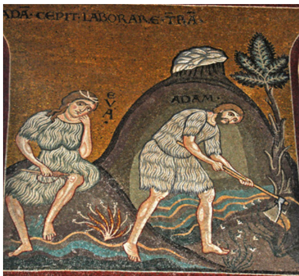
Fig. 2. Mozaic din Catedrala din Monreale. Foto: R. Stracke [14].

cu noi amănunte. Acestea din urmă relevă valențe atribuite muncii primilor oameni, precum și muncii în general.