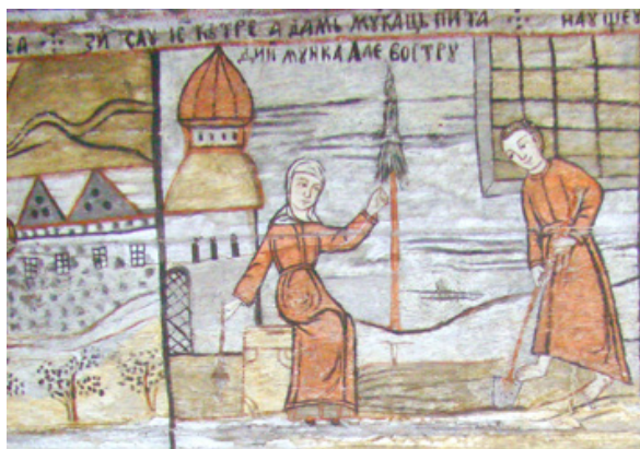
Fig. 7. Adam și Eva, Călinești-Josani [37].