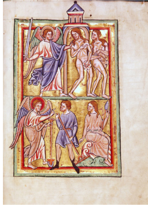
Fig. 4. Miniatură din Psaltirea regelui Ludovic IX cel Sfânt [19].

de sub nicovală [14]. Cunoaștem și alte opere de artă în care ambii protopărinți sunt ocupați cu muncile câmpului – un antependium (panou care împodobește altarul) de fildeș din Catedrala din Salerno (sec. XI–XII), o miniatură a Bibliei din Ripoll (Spania, a doua jumătate a sec. XI), un basoreliev din Modena [17, p. 162; 3, p. 883].