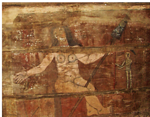
Fig. 8. Eva (?), Săcălășeni [38].

p. 59-61]. În Biserica Domnească „Sf. Nicolae” de la Curtea de Argeș, într-o frescă din 1750, vedem imaginea unui bărbat (Adam?) arând pământul cu plugul și doi boi [40, planșa 21]. Regăsim ocupațiile lui Adam și Eva, de asemenea, într-o miniatură a celebrului artist plastic popular Picu Pătruț (1818–1872) [41, p. 263]. Exemplele citate denotă că motivul muncii primilor oameni, frecvent în arta medievală europeană, este prezent pe larg și în vechea artă românească. Picturile respective, presupunem, au inspirat reflecția populară asupra originii și semnificațiilor muncii.