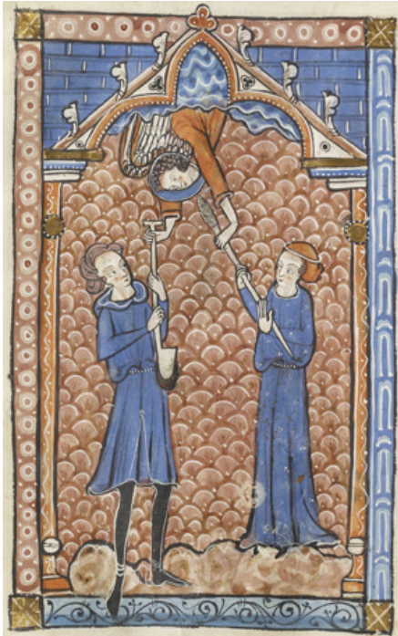
Fig. 3. Miniatură din Psaltirea Carrow [18].