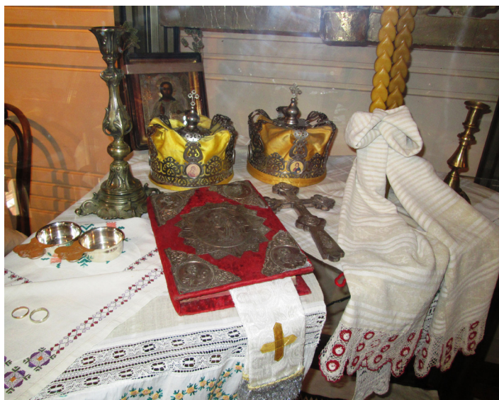
Piese de cununie, MNEIN.