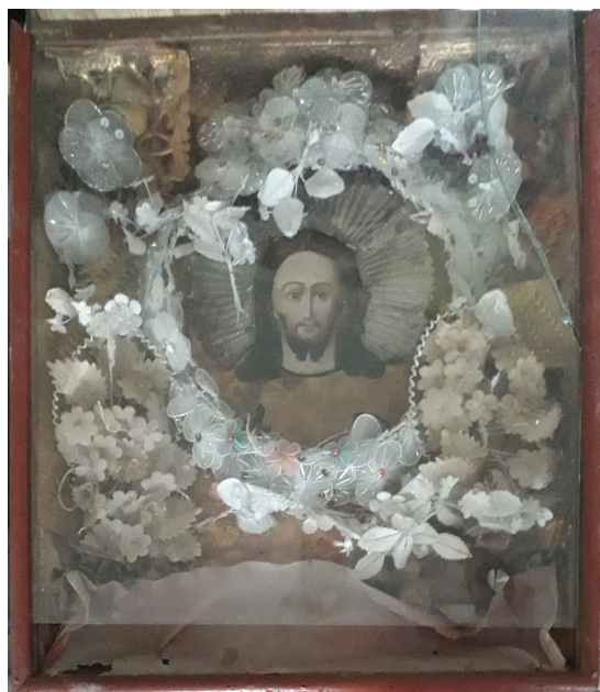
Cununa icoană, s. Cărbuna.

de, roșu, galben, salbă monetară trecută până aproape la brâu, de obicei, 5-7 șiraguri de mărgelile înșirate pe fire decorative [11, p. 81].