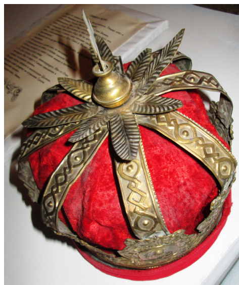
Cununa, s. Besalma, r-nul Comrat.

începutul secolului XX, nu mai făceau parte din portul miresele. Acestea au revenit însă în vestimentația miresele după cel de-al Doilea Război Mondial. Un exemplu de costum tradițional de mireasă oferă tabloul artistului plastic Elena Bontea „Mireasa” (1967). Mireasa poartă coroană-cunună, salbe de mărgelă la gât și cercei în ureche, în formă de semilună sau inimioară stilizată „moldovenesc”.