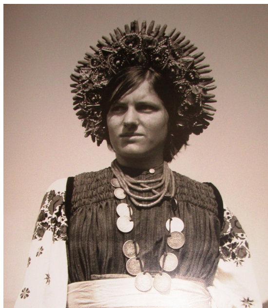
Cununa, r-nul Camenca, MNEIN.

Inelele sunt accesoriile indispensabile ceremonialului nupțial. Ele pot fi clasificate în următoarele categorii simbolice: 1) inele de logodnă, care pot fi cu sau fără pietre, elemente decorative, email etc.; 2) inele de căsătorie, folosite pentru căsătoria civilă; 3) inele de cununie, o varietate aparte pentru doritorii de a semnifica cununia religioasă; 4) inele de căsătorie cu ocazia a 10, 25, 50 etc. de ani de căsătorie. Aceste piese erau de o mare diversitate în perioada interbelică, grație faptului că, doar la Chișinău, în anii 1930, activau cca 90 de bijutieri. Inelele de logodnă și de cununie erau confecționate din aur, mai rar argint, simple, cu sau fără motive decorative. Uneori la dorința mirilor pe partea verso a inelului se grava numele persoanei îndrăgite. În perioada sovietică, cununiile religioase au fost interzise și, ca re-